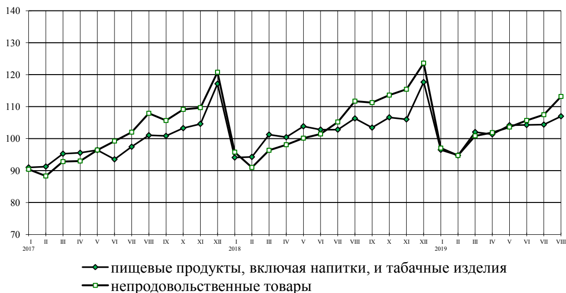
Динамика оборота розничной торговли пищевыми продуктами, включая напитки, и табачными изделиями, непродовольственными товарами в % к среднемесячному значению 2016 г.