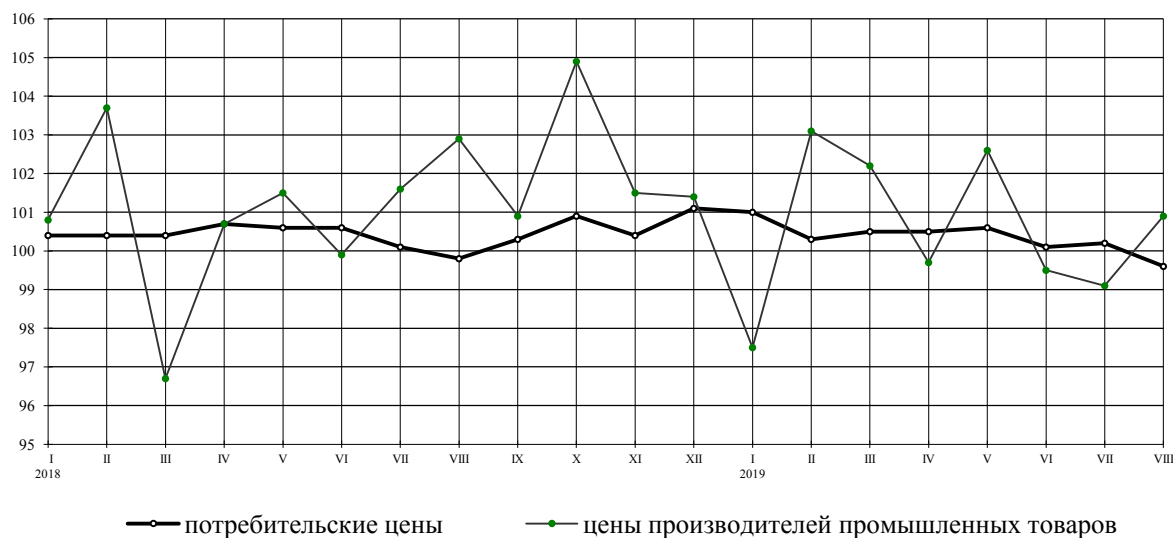
Индексы потребительских цен и цен производителей промышленных товаров на конец месяца, в % к предыдущему месяцу